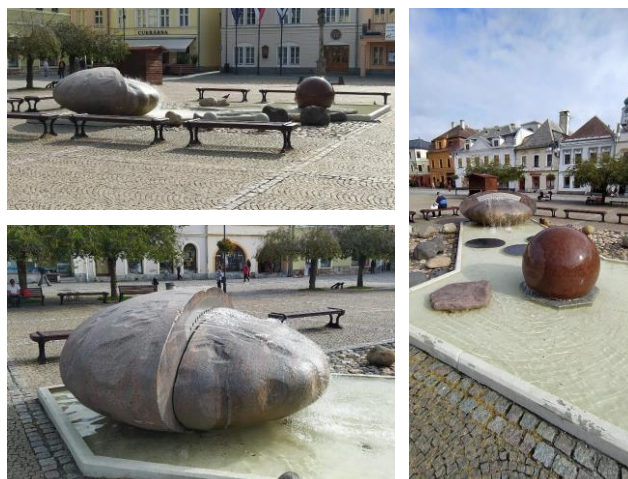
Foto: Springbrunnen auf dem Marktplatz in Bruntál